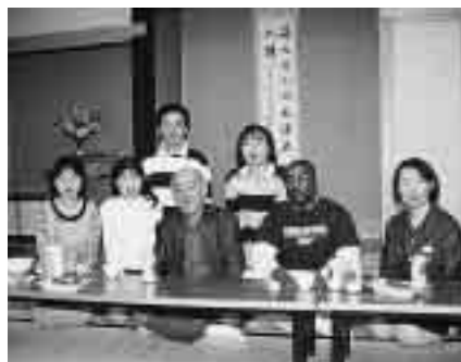
4月の花見（国際村にて）

ぶ側と教える側が一緒に授業をつくれるように、がんばっています。 今年度に入ってから受講者の数が増え、今年の春には両教室合同で「花見」をしました。あいにくの天候で国際村内で行なわれましたが、二十五名程が参加した楽しい親睦会になりました。