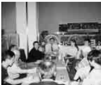
参加者の質問に答えるゲストの先生方

三名の先生はそれぞれの立場からお話しいただきましたが、共通する点はネイティブスピーカーを通して生徒達が外国人との「壁」