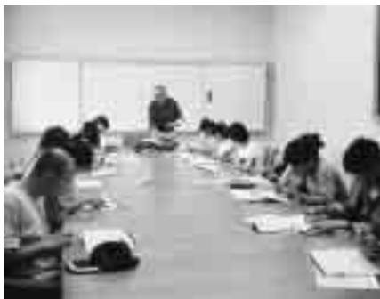
日本語教室の学習風景

指導者は二教室合わせて十二名。すべてボランティアで指導にあたっています。日本語指導の経験は人それぞれですが、学