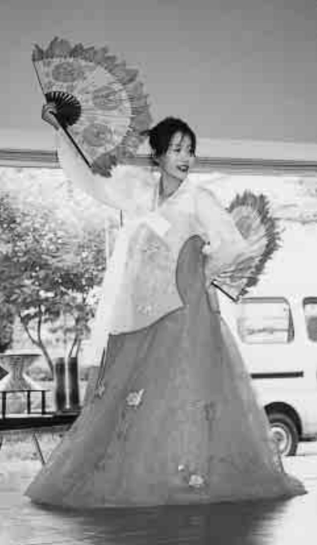
優雅な韓国の踊り