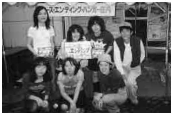
ワールドバザールにて