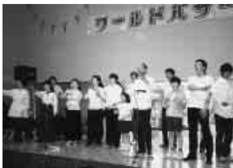
ゴスペルを歌う会(ワンネス) (フーラカーネーション)によるフラダンス