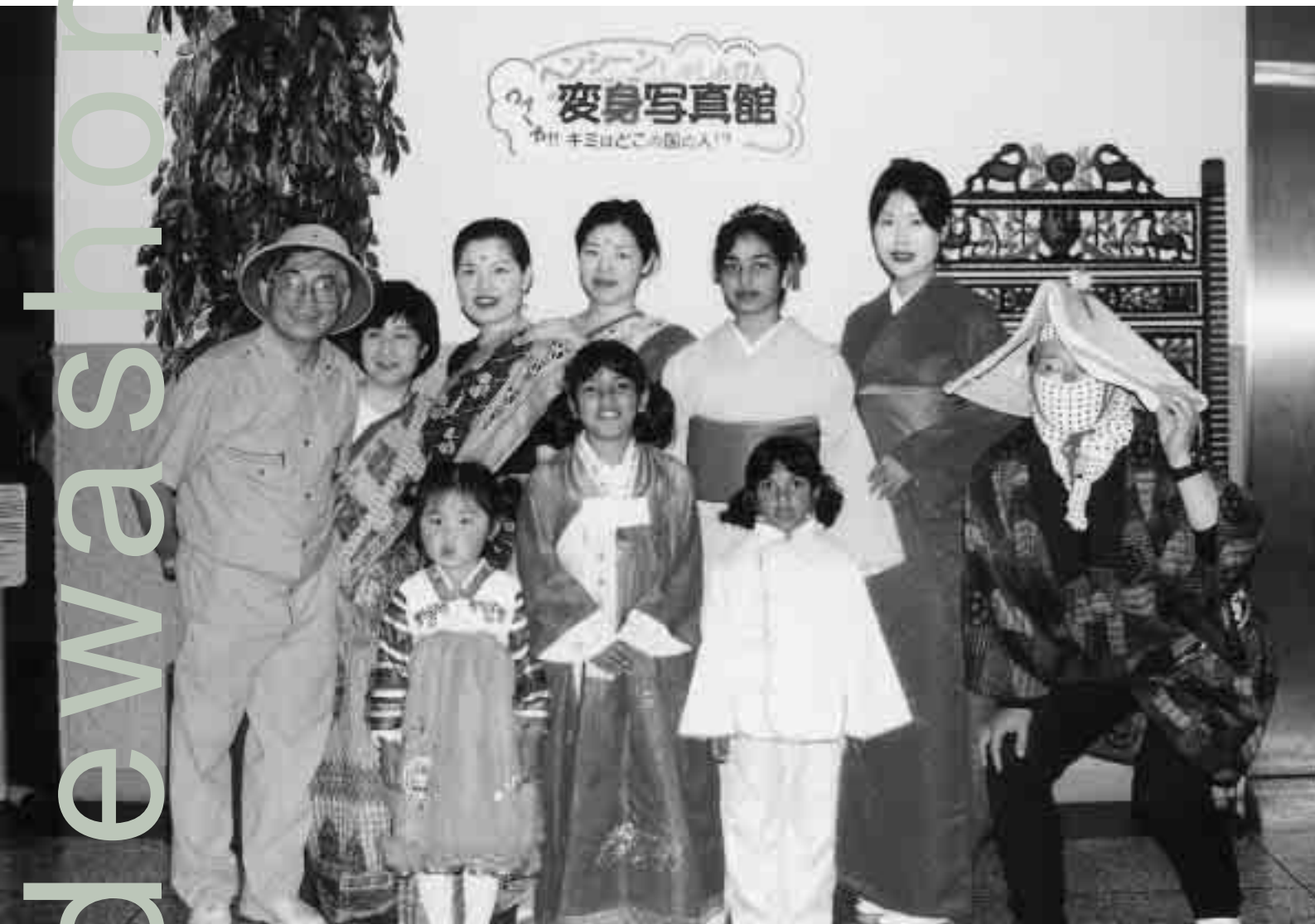
6 / 10 「ワールドバザール」で民族衣装を身につけて