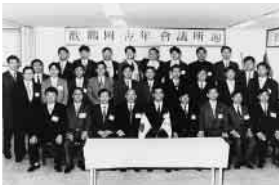
大韓民国ハムヤンJCへの訪問

会員数：高校生6名 定例会：必要に応じて 会費：年3,000円 連絡先：ユース・エンディング・ハンガー・ジャパン (ハンガー・フリー・ワールド内) (☎03-3261-4700) まで