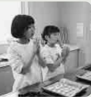
みんなでボンデケイジョ（ブラジルパン）をコネコネ。（上）