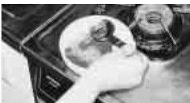
手作りラー油、ジュワー!!

熱したフライパンに、大さじ4杯の油を入れる。 器に、大さじ2杯のトウガラシを入れ、を加えてかき混ぜる。これが手作りラー油だ! 手作りラー油小さじ1杯に、各種調味料を加え、みじん切りしたニンニクをを加え、食べる直前に具と混ぜ合わせて完成。