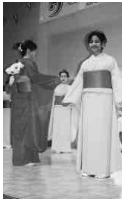
日本の美、着物。すばらしい帯の花むすび