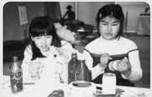
オリジナルのマラカスはどんな音？