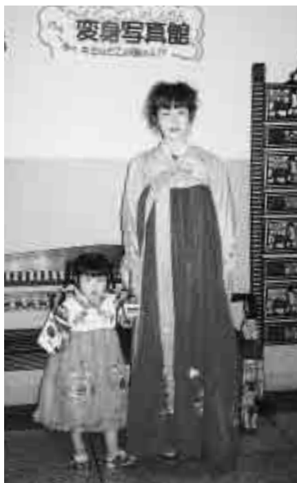
好評だった各国の衣装を着ての変身写真館