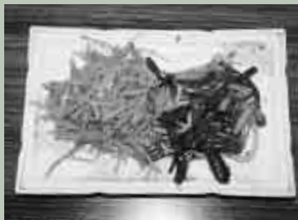
ジャガイモのサラダ(左) ニラとモヤシのサラダ(右)