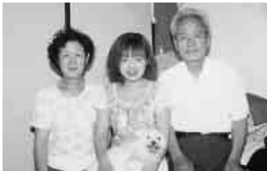
久しぶりに来日したご両親とともに

人との信頼関係を築くのはたくさんの方の時間と心が必要だと思います。国や言葉が違うともっと大変です。しかし、それが今一番楽しい事でもあります。個人と個人の信頼関係があるの国際交流です。基本的に普通の人間関係と何も変わりはありません。まずは「友達になりたいよ」と相手に伝え、おしゃべりから始めます。このようにしてたくさんの方と関わりを持ち、たくさんエネルギーをもらって、学生としての私、先生としての私、個人としての私をがんばることが出来ています。