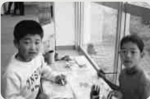
ピラルクのこいのぼりきれいにぬれた？

アマゾン民族館で五月五日、子供達を対象にアマゾン子どもフェスティバルが行われ、計二八四名の参加者が集まり、にぎわいました。 インディオの暮らしを楽しく理解してもらおうと、新しく「食べる」「奏でる」などのコーナーが設けられ、焼きたてのブラジルパンの試食やステビア茶の試飲、ペットボトルのマラカスづくり、沢山の親子づれが楽しい時間を過ごしました。