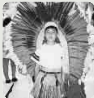
首長みたいでかっこいい！