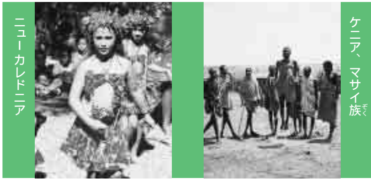
ニューカレドニア