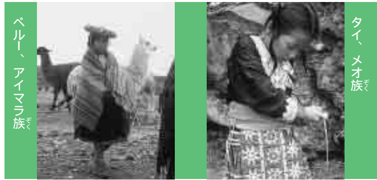
ペルー、アイマラ族