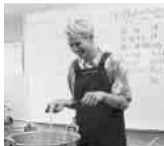
ワールドクッキング「ハワイ編」

日本語教室 様々な国の方々がボランティアの先生方と一緒に、楽しく日本語を勉強しています。 ● 日曜日 午後二時～四時 ● 火曜日 午後七時～八時三十分 どちらも参加無料です。