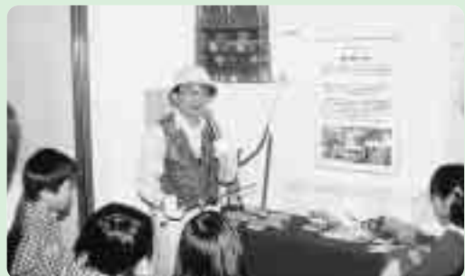
山口館長、衣装を語る