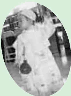
カワイイ オキヤクサマ