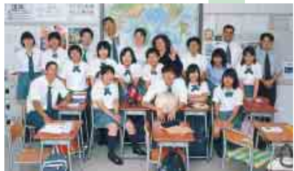
平成14年度「エアメールの会」新会員

この会の大きな目的は、生徒同士、保護者同士で情報交換しながら、生徒はもちろんのこと、保護者の留學に対する不安等を解消し、安心して子供達を海外へ送り出すことでした。定例活動としては、出羽庄内国際村等で、3月に総会を7月に長期留學生帰郷報告会を開催しております。