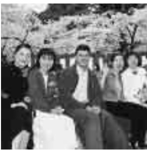
日本語教室の花見風景

日本語教室 様々な国の方々がボランティアの先生方と一緒に、楽しく日本語を勉強しています。 ● 日曜日 午後二時～四時 ● 火曜日 午後七時～八時三十分 どちらも参加無料です。