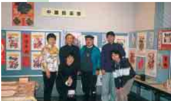
今年の国際村ワールドパズルでの展示の前で

国際映画祭等でも高い評価を受けている中国映画を鶴岡でも鑑賞したい、中国の文化をもっと楽しみたい、活動を通して日中友好交流ができたらということで会を発足しました。主な活動としては、毎月1回の例会で、中国語圏の映画を上映、一般の方向けにも上映会を開催したり、毎月会報を発行して情報の提供、年に1、2回の中国料理を楽しみながらの交流会を開催しています。今後も中国映画を楽しむ例会を軸に音楽、料理、中国将棋、中国関係書籍の紹介等、中国文化を楽しんでいく予定です。今年は胡弓も習いたいと考えています。現在、会員は日本人、中国人の20代から80代までの男女で和気藹々と活動しています。中国が好き、映画好きな方等、いつでもどなたでも中国倶楽部では熱烈歓迎しています。