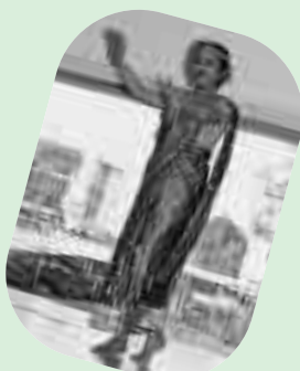
オリジナルダンスを披露