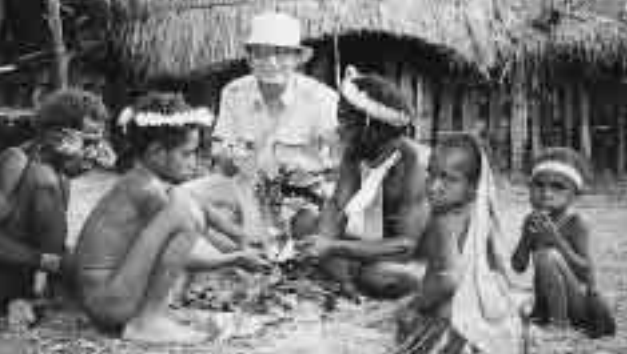
イリアンジャヤ、ダニ族の家族と館長