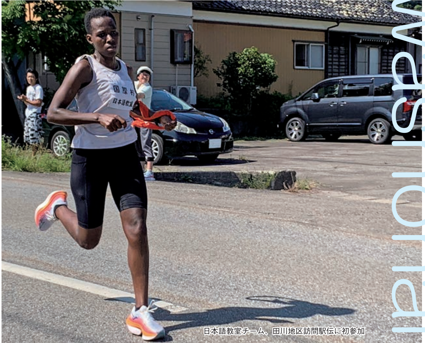
日本語教室チーム、田川地区訪問駅伝に初参加