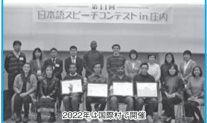
2022年は国際村で開催

出羽庄内国際村日本語教室、(公財)出羽庄内国際交流財団、三川町、庄内町国際交流協会、サポートボランティア「わ」、酒田市国際交流サロン、日本語学習支援ボランティア べにばな会、遊佐町日本語講座ボランティア