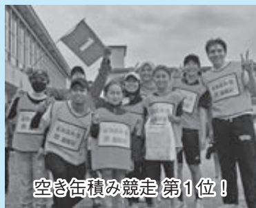
空き缶積み競走 第1位!

今年も田川地区の大運動会に、日本語教室の学習者たちが参加をしました。通算4回目となる今年は、学習者やその家族、サポーターの日本語指導ボランティアなど約40名が参加。選手はベトナム、モンゴル、インドネシア、中国、オランダ、フィリピン、メキシコ、エチオピア、ケニア、台湾と出身国・地域が様々で、まるで国際大会のようでした。普段、勉強や仕事があり、運動会のための練習はできませんでしたが、全11種目のうち10種目に出場。国際村チームの総合成績は前回と同じく10チーム中8位でした。