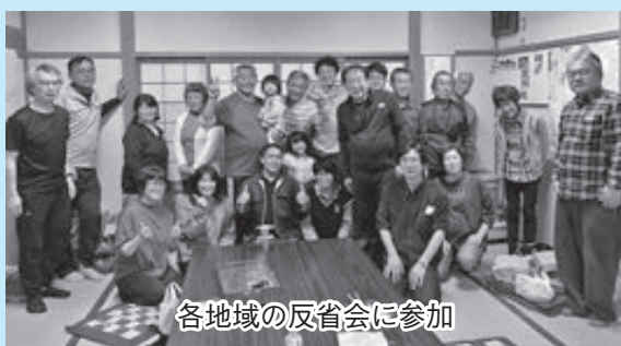
各地域の反省会に参加

運動会終了後は、各地域の反省会にも参加させていただきました。地域の皆さんから温かい歓迎を受け、言葉の壁や食事のルールの違いなどありながらも、一緒に会食をしながらおしゃべりをして大いに盛り上がり、地域住民との交流を深めることができました。このような貴重な体験をさせていただいた田川地区の皆様、ありがとうございました。