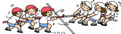
② つなひ 綱引き