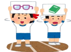
① か もの きょうそう 借り物競争