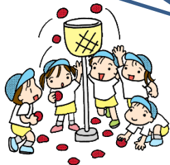
③ たまひ 玉入れ