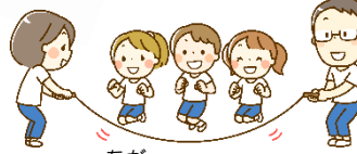
⑤ なが なわ とび